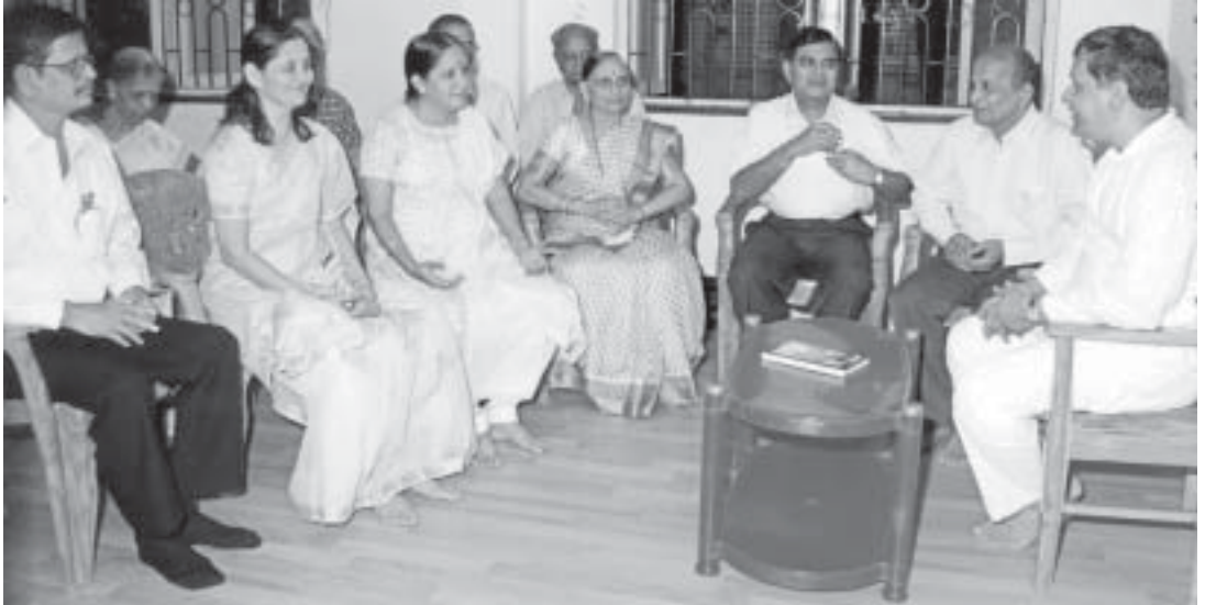
कार्यालयात शिक्षकांची बैठक