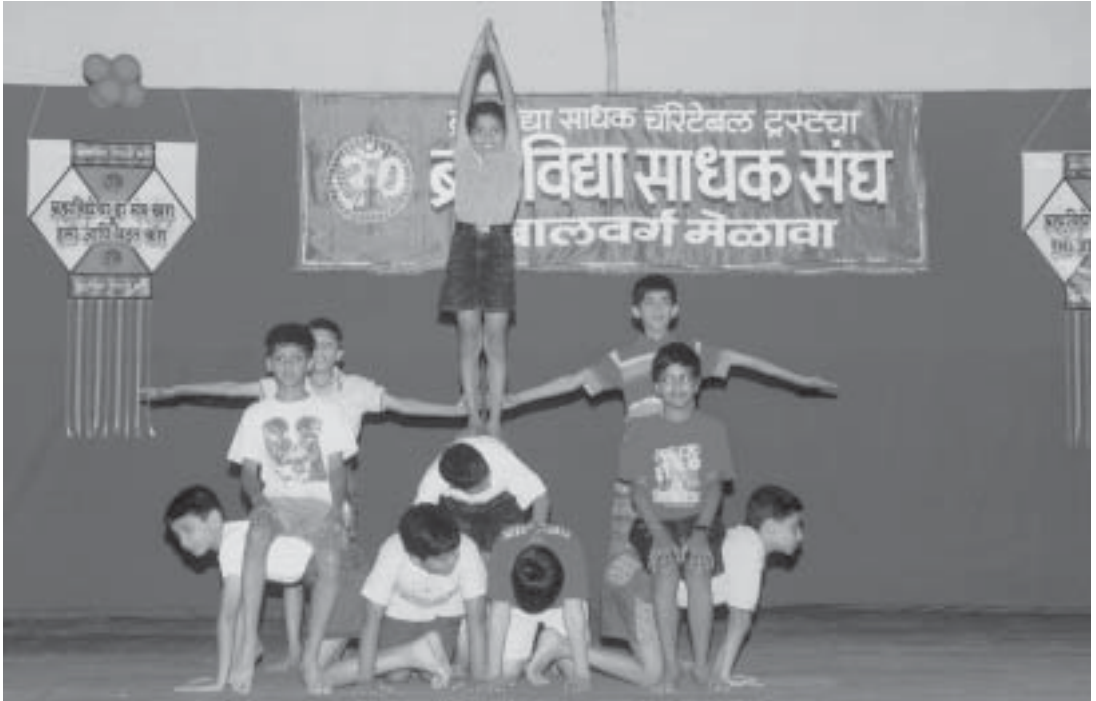
विलेपार्ले बालवर्ग मेळावा नोव्हेंबर २००६