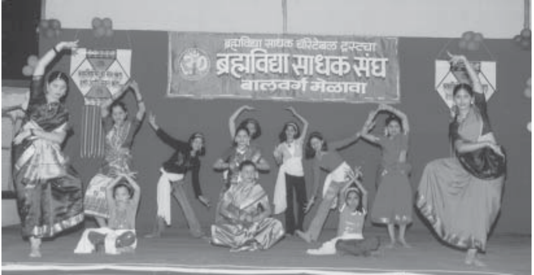
विलेपार्ले बालवर्ग मेळावा नोव्हेंबर २००६